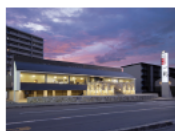
中府店 丸亀市中府町1-2-3 TEL 0877-22-9100