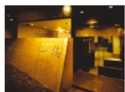
丸亀本店 丸亀市浜町317 TEL 0877-22-9111