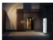
高松店 高松市鍛冶屋町4-11 TEL 087-823-3711