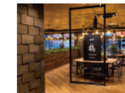
中洲店 福岡県福岡市博多区中洲2-3-8 FPG links NAKASU 5F TEL 092-291-0817