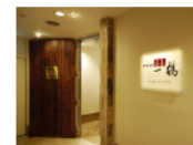
心斎橋店 大阪市中央区心斎橋筋 2-6-14 アクロスビル3F TEL 06-6213-0817