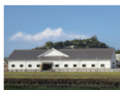
土器川店 丸亀市土器町2-12-33 TEL 0877-23-3711