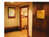
西梅田店 大阪市北区曽根崎新地 1-3-26 ぐらんぱれ4F TEL 06-4798-0817